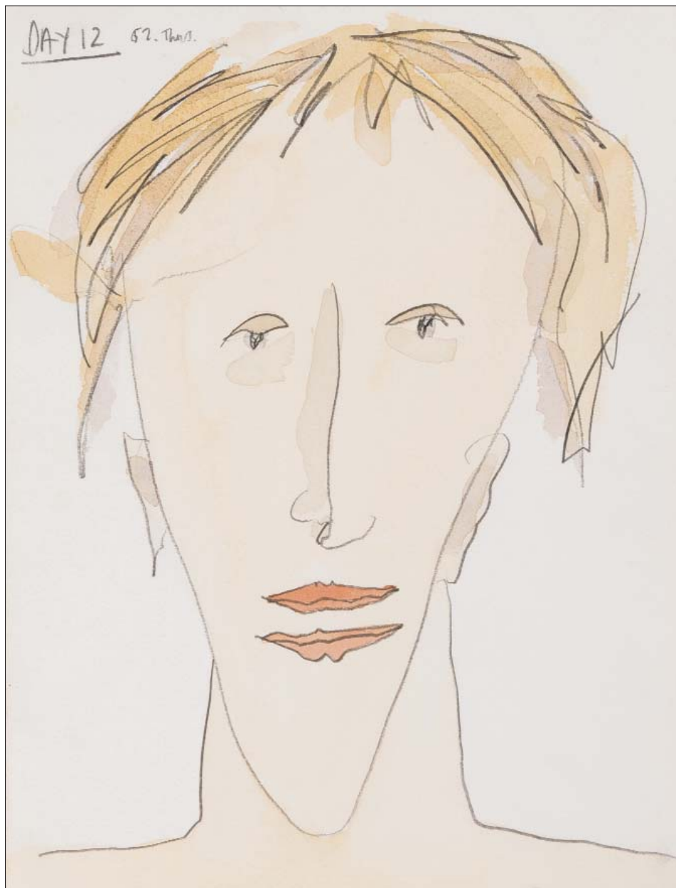
Working title: 2 mouths.

De mange figurative tegninger beskriver sindstilstande og nogle af alle de behandlingsformer – heraf også de barske sider – som Bobby Baker selv har stiftet bekendtskab med; mødet med psykologer, medicinering, det offentlige behandlingssystem, hendes oplevelser med, hvordan omverdenen opfatter og forholder sig til psykisk sygdom samt naturligvis betydningen af familie, venner og arbejde som en