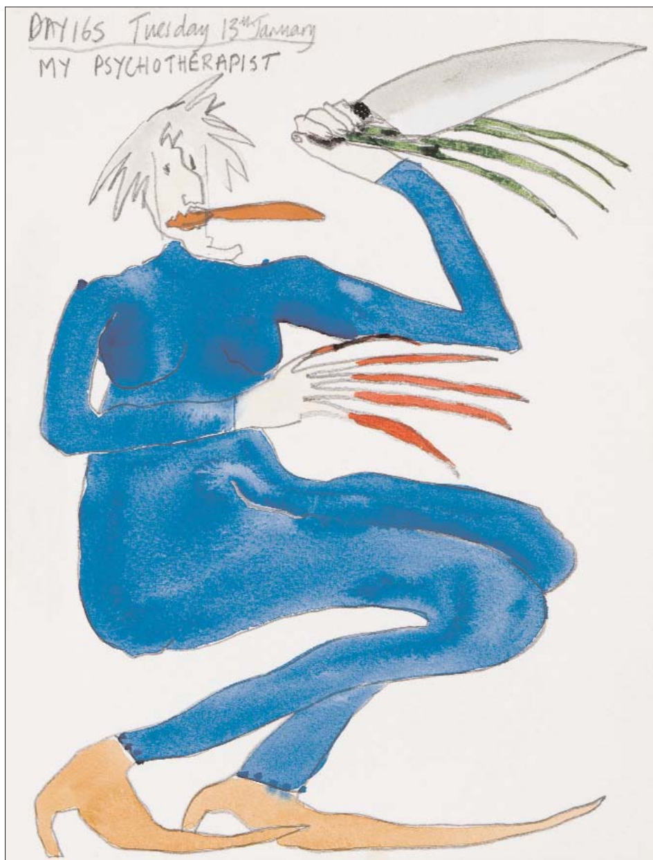
Working title: My Psychotherapist.

Bobby Baker anvender humor og en god distance til sig selv – og til de situationer, hun har befundet sig i. Ellers kunne hun heller ikke se og "formulere" motiverne, som hun gør. Tegningerne er følsomme, dramatiske, morsomme og barske. Hun samler og henter indtryk som brikker til et puslespil – til billeder og udtryk, der prenter sig fast på nethinden – og ofte i hjertekulen.