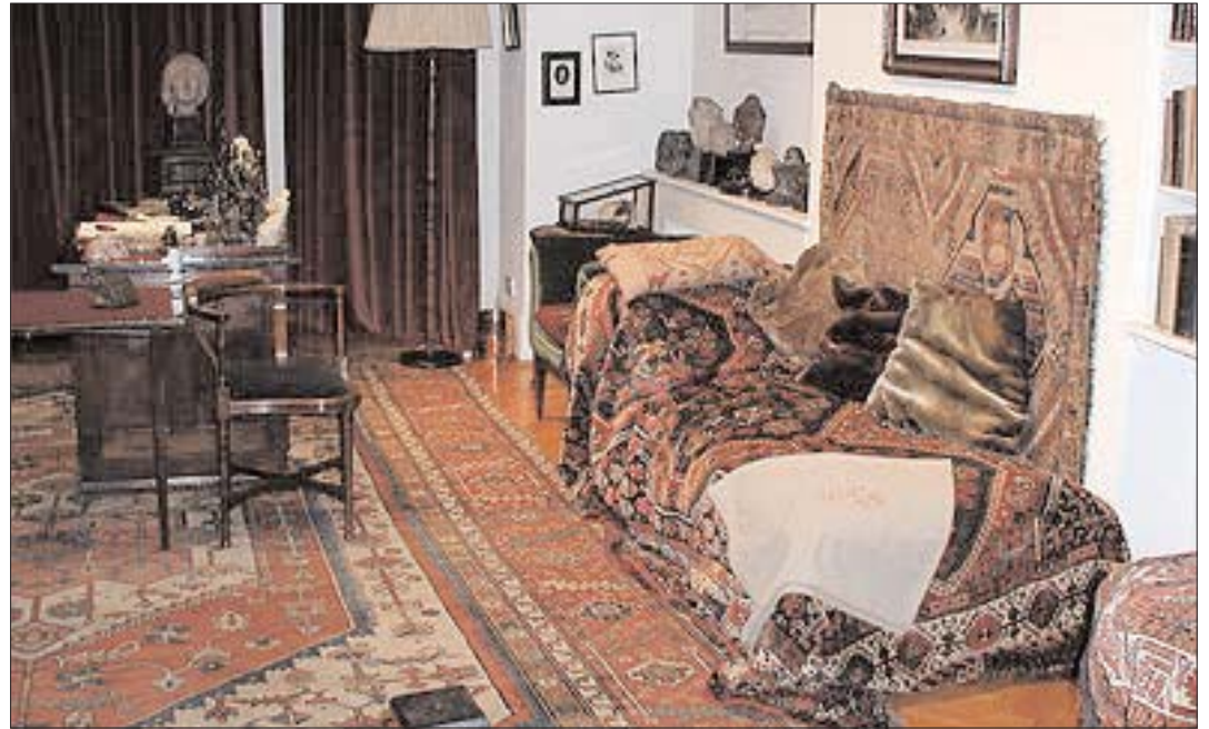
Freuds konsultationsbriks, Freud-museet i London

Radisernes Trine med sin psykologbod ved vejen – 25 øre for hjælp – blev et symbol på psykoanalysen i det lille, snart fordums, bondeland.