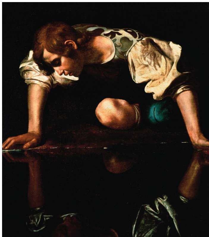
Narcissos bliver forelsket i sit eget spejlbillede. Værket "Narcissos" er skabt af den italeriske mester, Caravaggio, fra 1597-99.

I 1984 kom første bind af Egmont Fondens Fremtidsstudium, Danmark år 2000. Man startede nederst med "De grimme ællinger". I afsnittet om de psykisk syge beskriver Jacques Blum, hvordan forskellige former for afvigelse kan betragtes som et spejlbillede af den "rådende normalitet". Er den nye type "gale" med