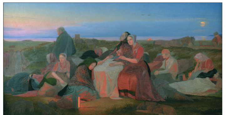
Jørgen Valentin Sonne: Skt. Hansnat. De syges søvn på Helenegraven ved Tisvilde, 1847.

Det stemningsfulde billede af de syge i den danske skærsommernat viser, hvad der netop ikke findes i narcissismens univers. Lidelsens realitet, dyb længsel og overjordisk fred, fælles empati, historiens rødder og overgivelsen til det, der er større end ego.