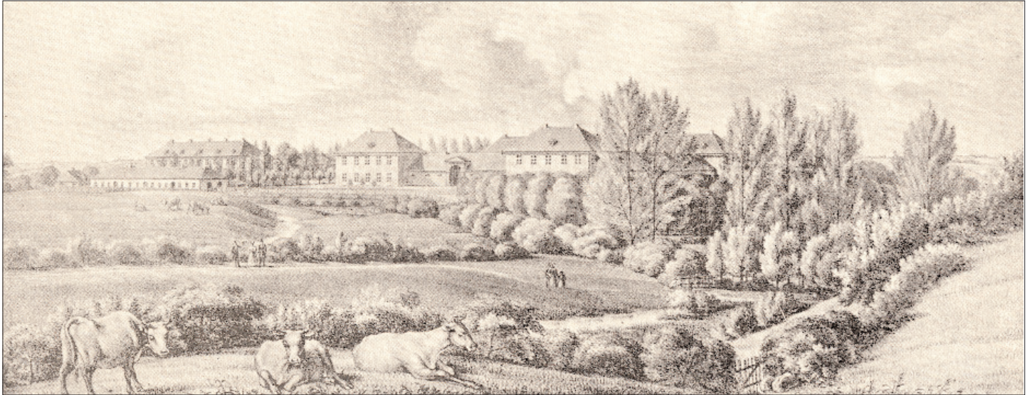
Arkitekten C. F. Hansen tegnede Slesvigeranstalten. Anstalten åbnede i 1820 som en af Europas mest moderne og humane indretninger til sindssygebehandling. Den var på danske hænder til nederlaget ved Dybbøl i 1864.

2 var for udlændinge og dyrest, her var kun de 2 første klasser.