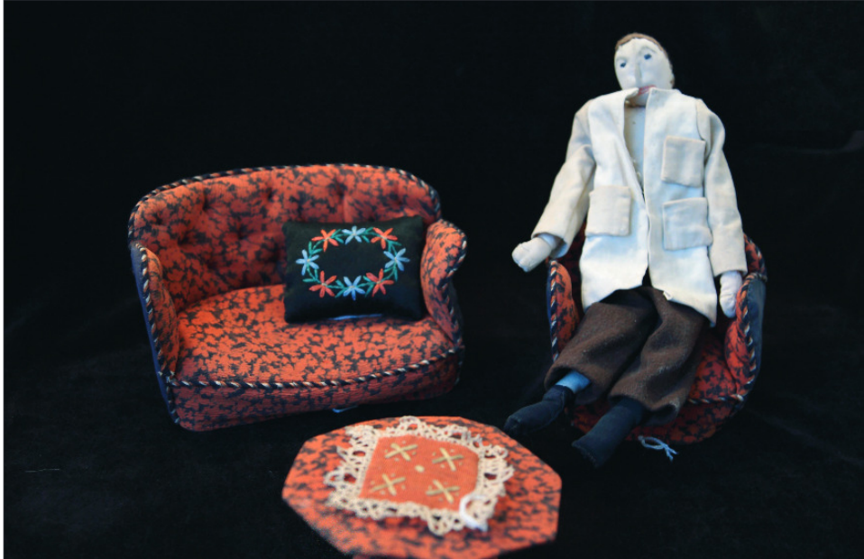
Sættet med de røde dukkemøbler er foræret til et medlem af en familie på Nordre Strandvej i Risskov mellem 1930 og 1950. Det er fremstillet af en kvindelig plejepatient, familien havde boende som medhjælp i husholdningen. Dukkemøblerne er smukt forarbejdet og har kostet mange timers arbejde. Var der en datter i familien, som skulle glædes med nyt til dukkehuset?