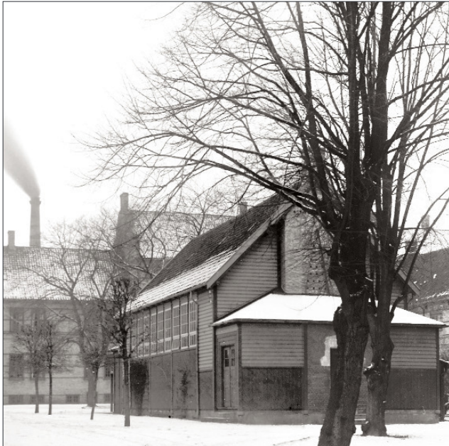
I mandshospitalets gård var denne træbarak i 1930'erne og 40'erne indrettet til gymnastiksal og biograf – en populær adspredelse, også for familieplejepatienterne i Risskov. Senere flyttede biografen til en nedlagt lade.