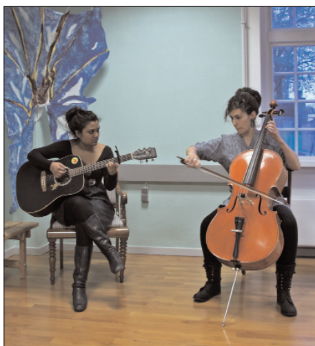
Duoen "Rokat" underholder.

Og så vores nye museumsplakat, der netop ses på forsiden af denne udgave