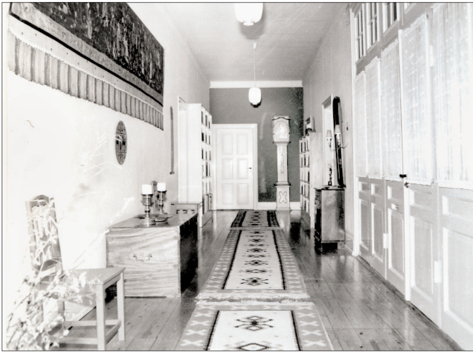
Den lange korridor i den syvværelses lejlighed, som overlæge Strömrgrens børn kunne udnytte til cykelbane.

af undersætter. Dette praktiseredes ved udveksling af konversation og hilser ved møder på "terrænet".